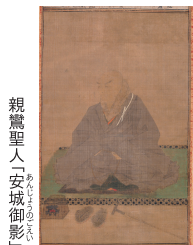
親鸞聖人「安城御影」

慶讃法要を機縁に、親鸞聖人のご生涯をたずねるパネル展。親鸞聖人の歩みをたどりながら、現代を生きる私たちに問いかけられた課題を考えます。