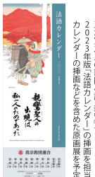
絵画 〈山口晃氏（画家）〉