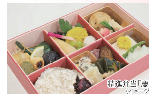
精進弁当「慶」 （イメージ）