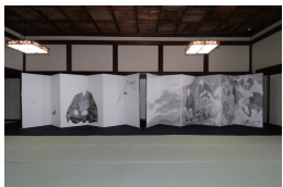
屏風「親鸞」 〈井上雄彦氏（漫画家）〉