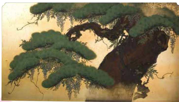
桜花図／松・藤花図のうち松・藤花図 望月玉泉筆 京都・東本願寺