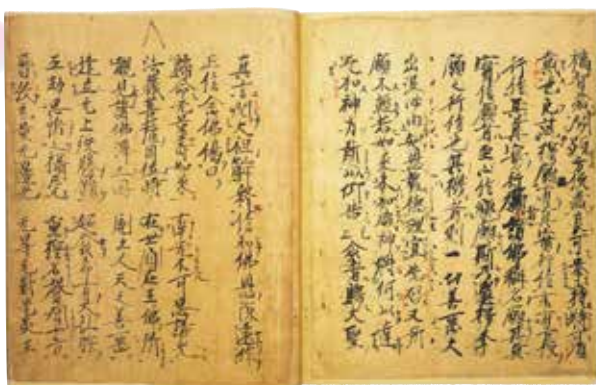
国宝 教行信証(坂東本) 親鸞筆 京都・東本願寺