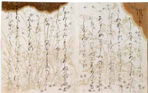
国宝 三十六人家集(忠見集) 京都・西本願寺