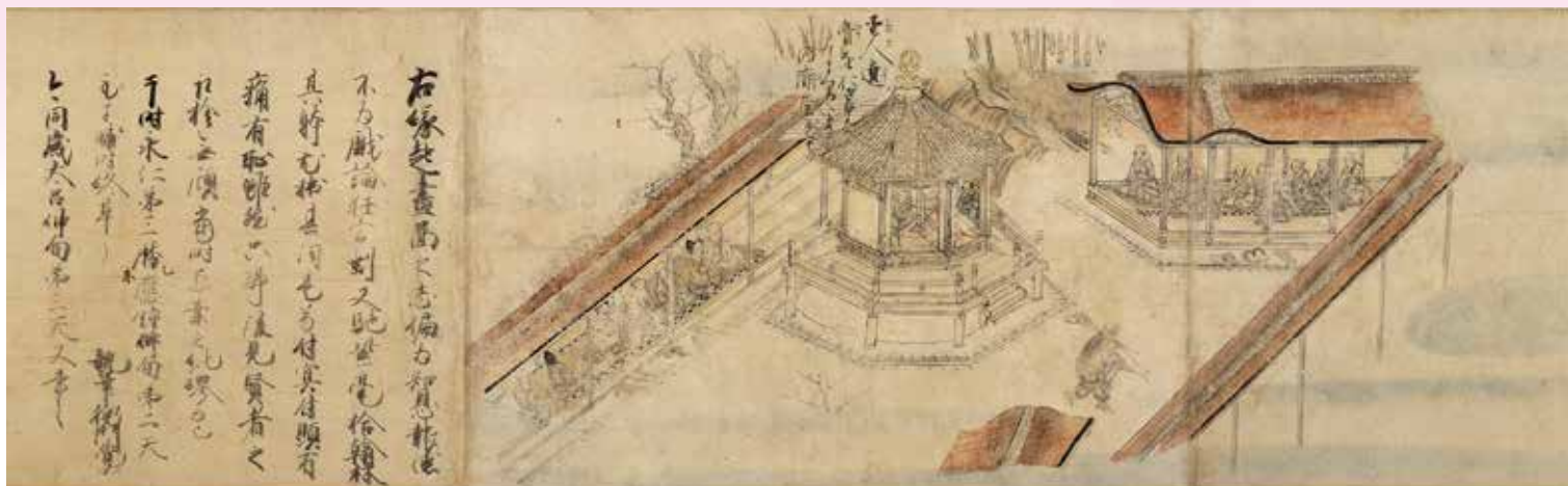
重要文化財 善信聖人親鸞伝絵(高田本)(部分) 三重・専修寺